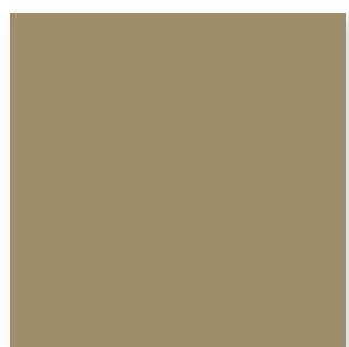
Visón (V) · RAL 1019 *