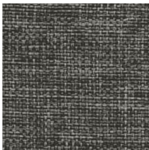
Cosv · CV17 · Gris