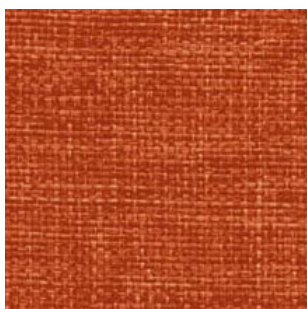
Cosv · CV5 · Naranja