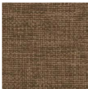
Cosv · CV4026 · Marrón