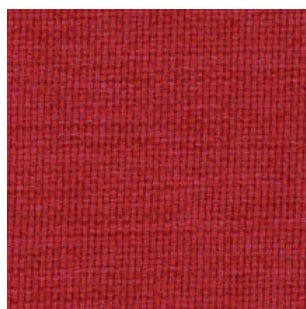
Cosv · CV59 · Coral