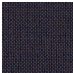
Cosv · CV91 · Berenjena