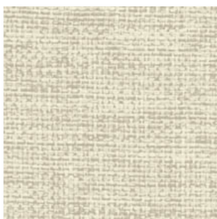
Cosv · CV4025 · Beige