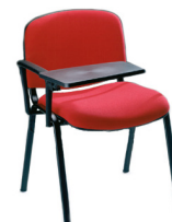
30-BP Pala escamoteable