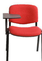
30-BPA Pala abatible