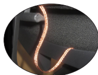
Detalle conducción de cableado especial