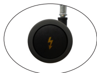
Rueda 65 mm antiestática

Rueda autofrenada antiestática. (Ref.8) Ø 65 mm.