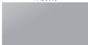
Plata (P) RAL 9006