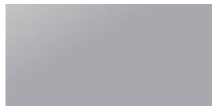
Plata (P) RAL 9006