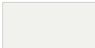
Blanco Texturado (B) RAL 9016