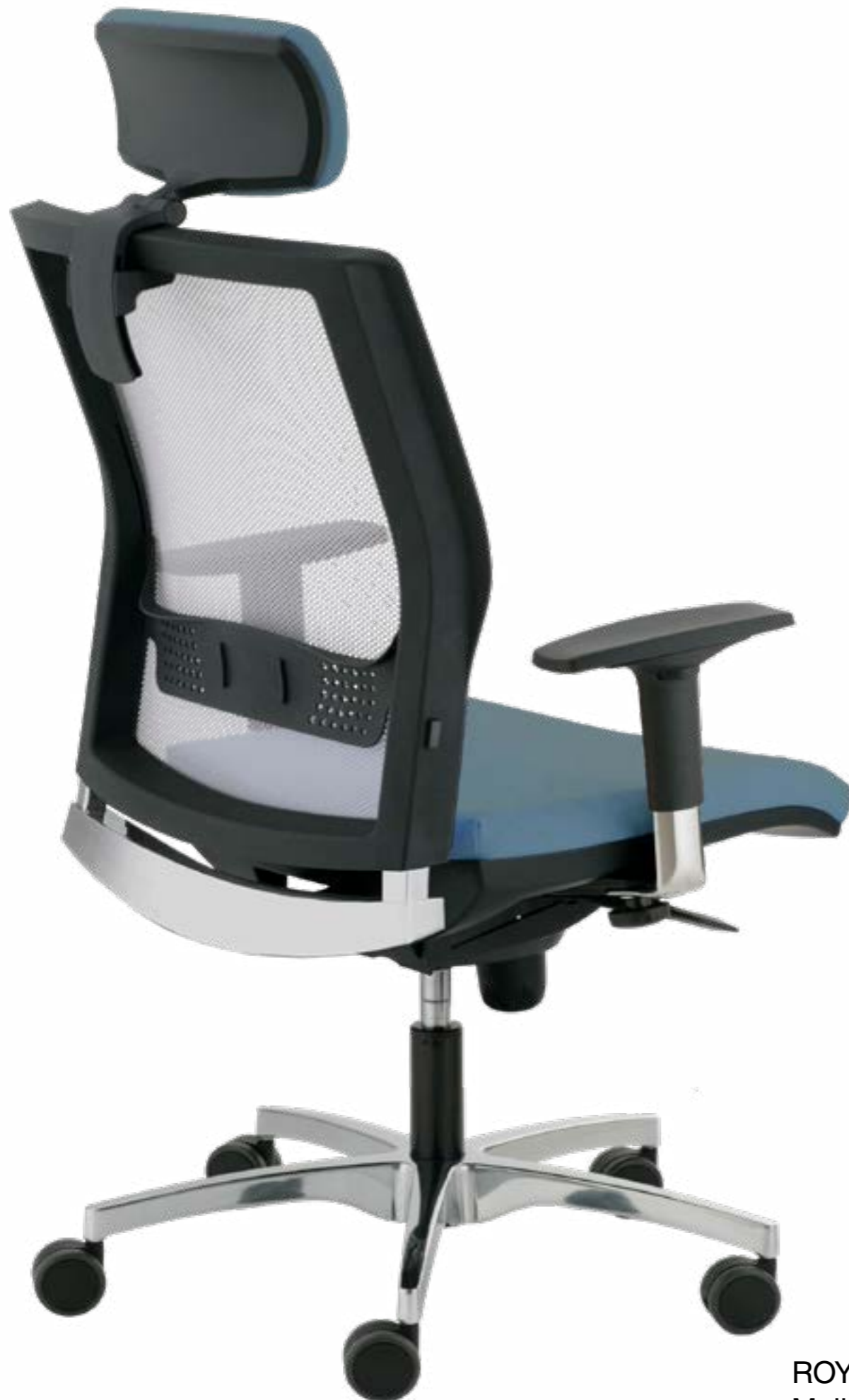
ROYAL Malla X2